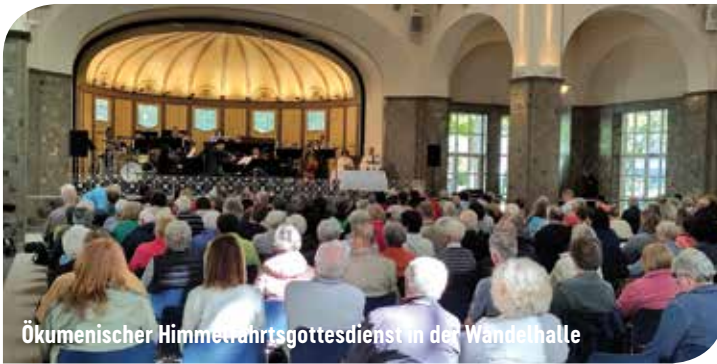
Ökumenischer Himmelfahrtsgottesdienst in der Wandelhalle