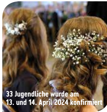
33 Jugendliche wurde am 13. und 14. April 2024 konfirmiert