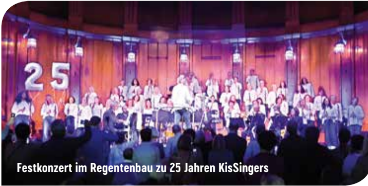
Festkonzert im Regentenbau zu 25 Jahren KisSingers