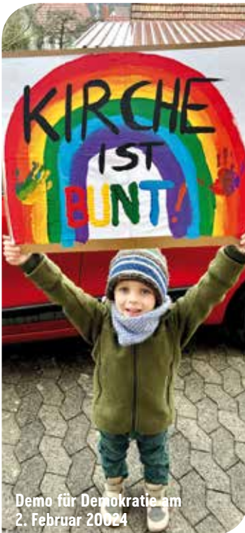
Demo für Demokratie am 2. Februar 2024