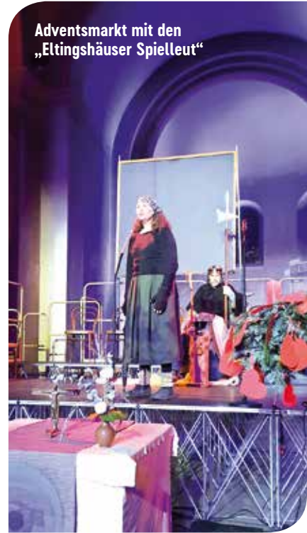
Adventsmarkt mit den „Eltingshäuser Spielzeug“