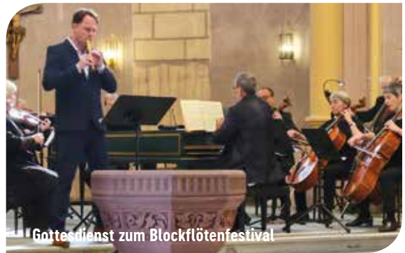
Gottesdienst zum Blockflötenfestival