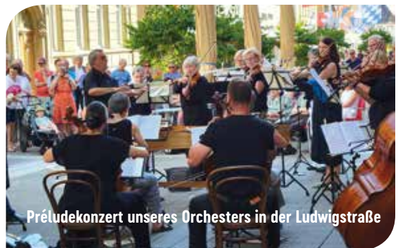
Préludekonzert unseres Orchesters in der Ludwigstraße