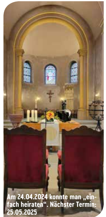
Am 24.04.2024 konnte man „einfach heiraten“. Nächster Termin: 25.05.2025