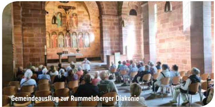
Gemeindeausflug zur Rummelsberger Diakonie