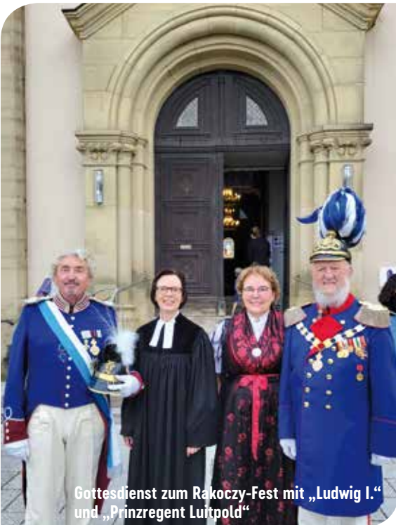
Gottesdienst zum Rakoczy-Fest mit „Ludwig I.“ und „Prinzregent Luitpold“