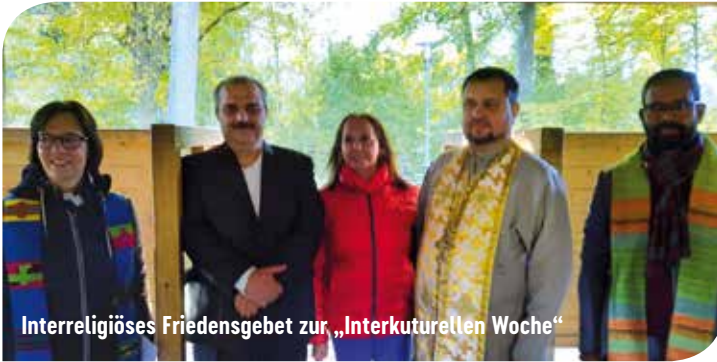
Interreligiöses Friedensgebet zur „Interkulturellen Woche“