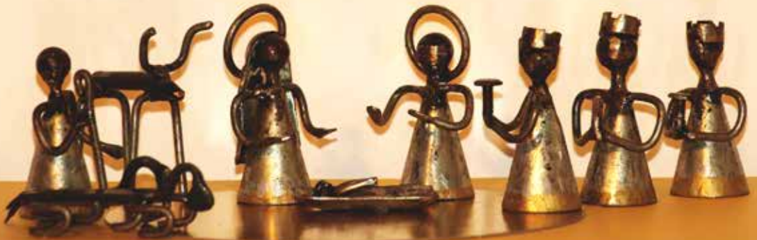
Recyclingkrippe aus Burkina Faso