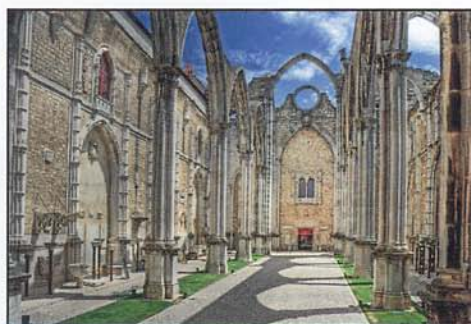
Die zerstörte Kirche von Carmo

Der Tsunami nach dem Erdbeben kostete in Europa ca. 100.000 Menschen das Leben.